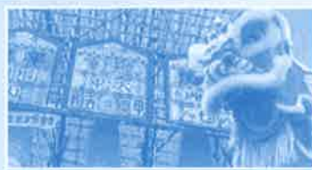
长洲太平清醮-抢包山