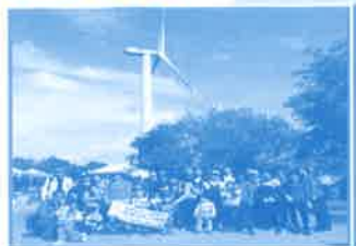
香港一日游-南丫岛