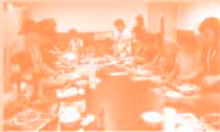
妇女组之手工披萨