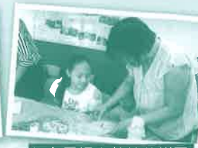
妇女同行之蔓越莓饼干