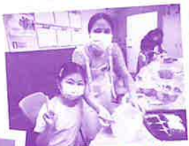
义工活动：满载关怀