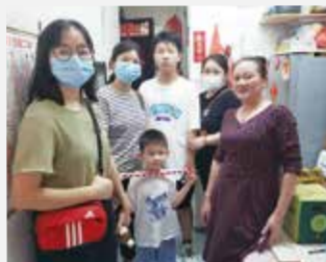
义工活动 - 社区探访