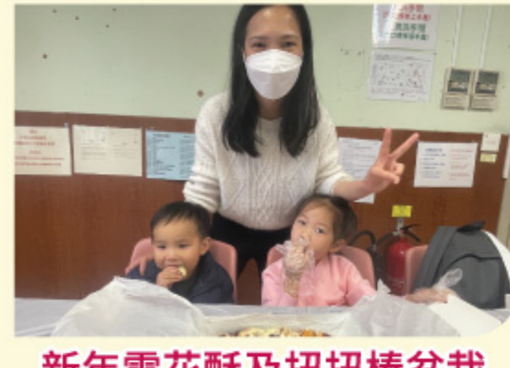
新年雪花酥及扭扭棒盆栽