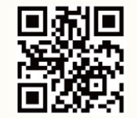
各专科门诊新症候轮候时间,请浏览二维码

市民如有不适,应先向家庭医学诊所或私家/家庭医生求诊,如需进一步由医管局辖下的专科门诊跟进、诊症、治疗及检查,诊所的医护人员会另外作出转介安排。病人须带同香港身份证(或有效身份证明文件),由本地注册医生在最近三个月内签发的医生转介信及住址证明前往登记预约。