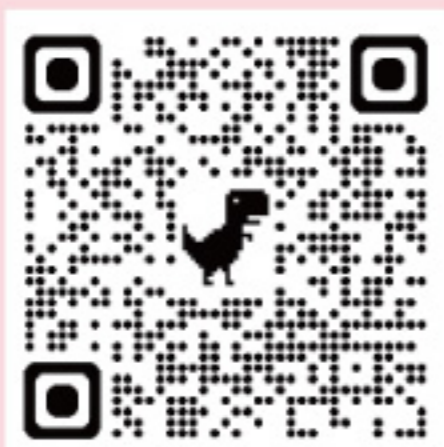
18间公立医院的急症室名单,请浏览二维码

医院管理局辖下的18间公立医院的急症室,为需要紧急服务的病人提供诊断及治疗。为了确保有紧急需要的市民前往急症室诊治时,获得及时的急症服务,所有急症室已经实行病人分流制度。病人登记求诊时,分流护士会根据病人需要危殆、危急、紧急、次紧急及非紧急治疗而予以分类。病人获诊治的优先次序,是视乎病人的病况而不是根据登记的时间。病人的情况如不危急,应向公立或私家诊所求医。