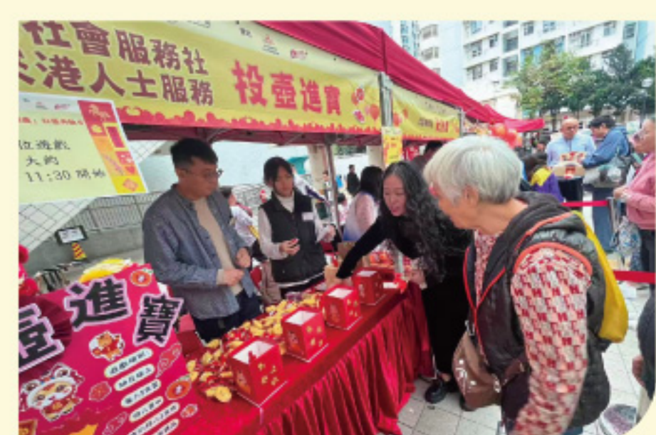
义工活动 - 新春摊位