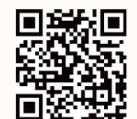
有关医疗收费详情,请浏览二维码

于公营医疗收费改革下,医院管理局(医管局)辖下医疗服务收费如下,相关收费已于2026年1月1日起生效。新来港人士使用公共医疗服务,请带备香港居民身份证及签证身份书。公众收费 - 符合资格人士