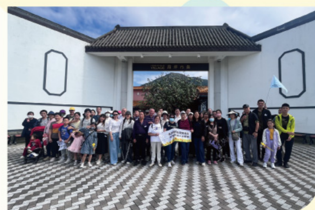
香港一日游 - 大屿山+大澳