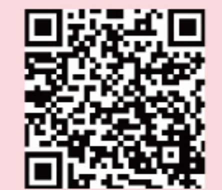
各家庭医学诊所预约电话,请浏览二维码

医院管理局(医管局)家庭医学诊所致力提供以社区为本的基层医疗服务,服务使用者主要包括长者、低收入人士和长期病患者。家庭医学诊所照顾的病人主要分为两大类,包括病情稳定的长期病患者(如患糖尿病、高血压等),以及症状相对较轻的偶发性疾病病人(如患感冒、肠胃炎等)。需要覆诊的长期病患者于每次覆诊后,诊所会按病人临床需要,去安排下次覆诊时间,病人无须另行致电预约。而偶发性疾病病人则可透过医管局家庭医学诊所电话预约系统或医管局一站式手机程序「HA Go」内的「预约家庭医学诊所」功能,预约未来24小时的诊症时间。就诊的病人应带备身份证明文件到诊所办理登记手续。如未能依时就诊,请尽早取消预约,以腾出诊症名额供其他有需要的病人预约。