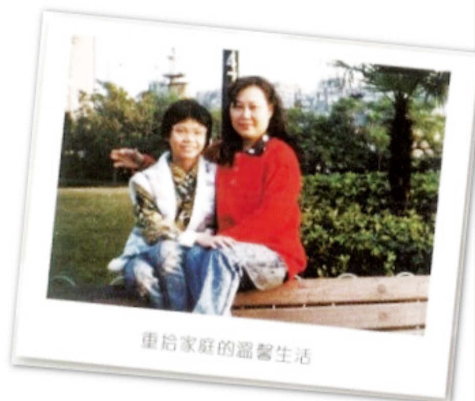
重拾家庭的溫馨生活